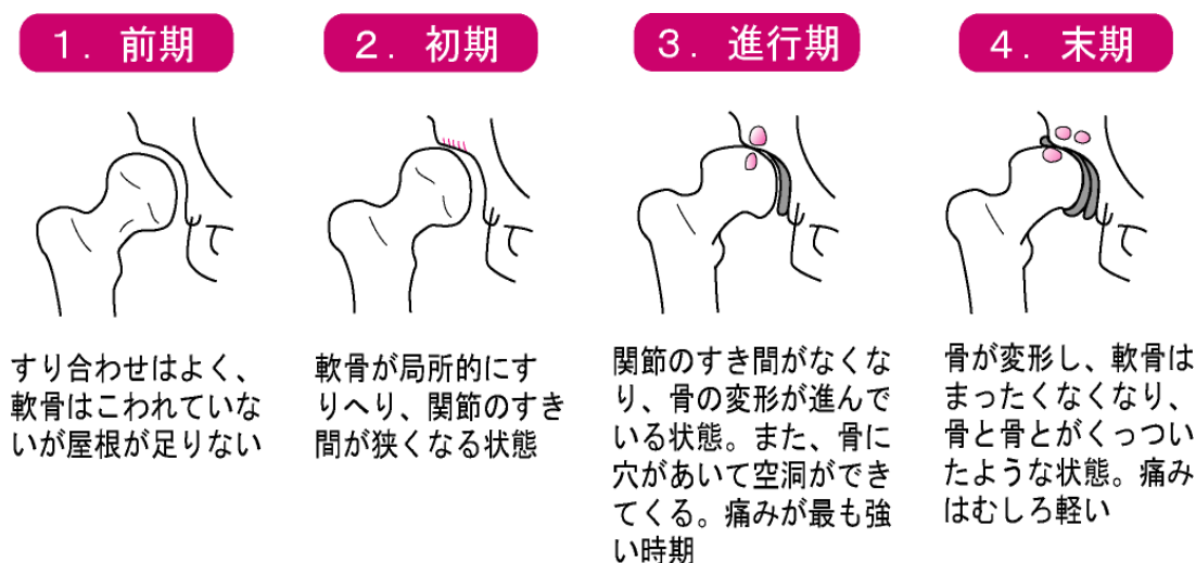
図 2：変形性股関節症の進展（二次性）